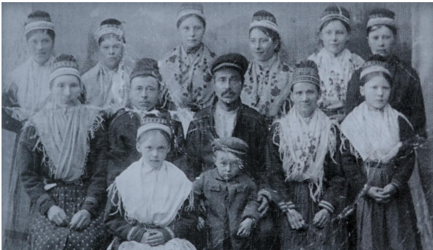
For publikum var bildet av beboere fra Novasletta før raset i 1936 gjenkjennelig.