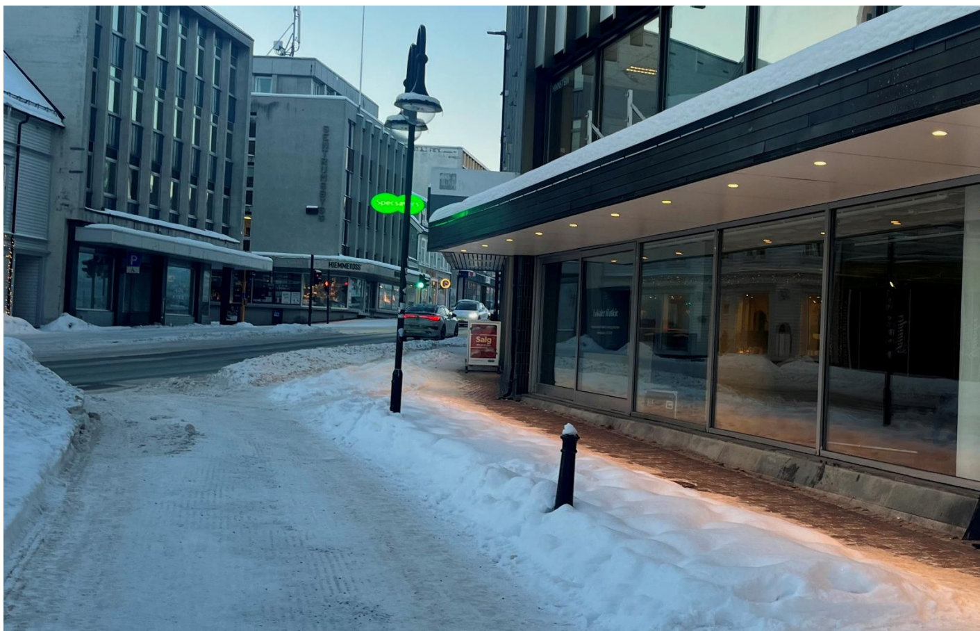
Plassering av lerret 2,4 m x 1,35 m og 55 toms LED skjerm i Sentrum 3 – Harstad.