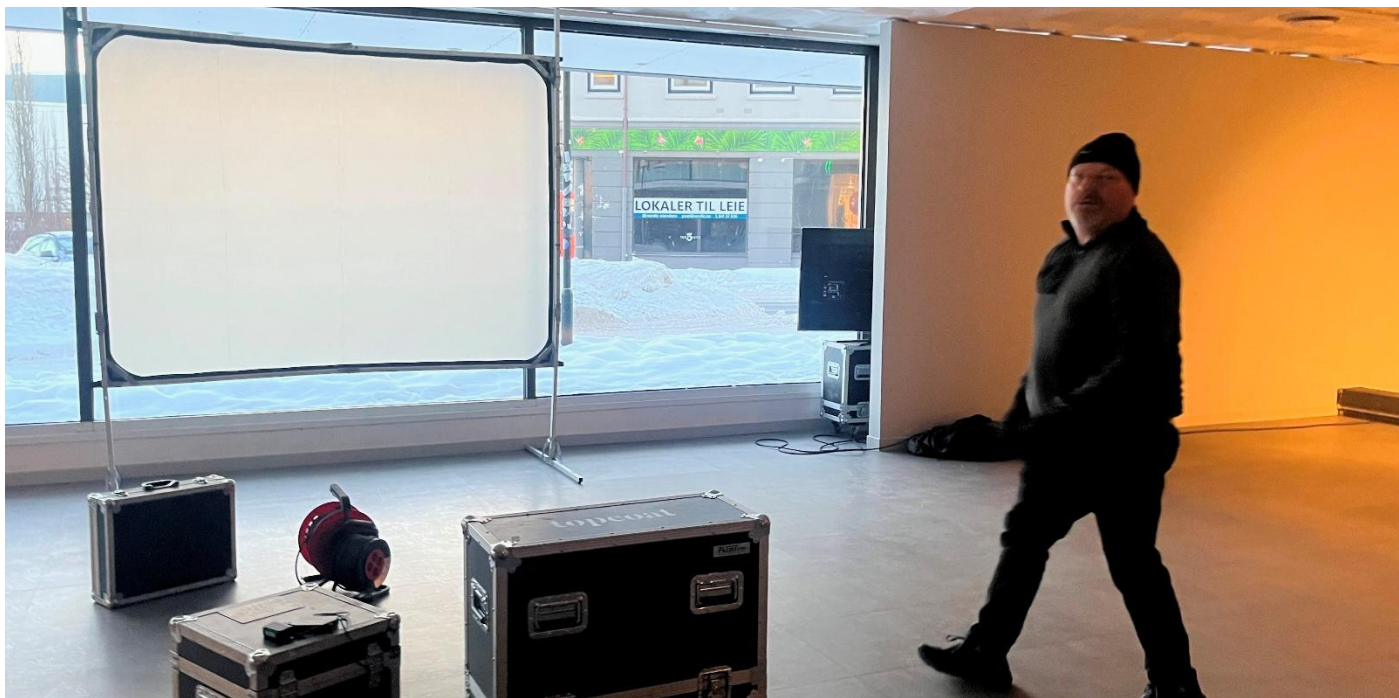
Innleie av TOPCOAT til lerret og LED-skjerm.